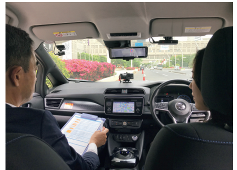
実車研修「ADST (Advanced Driving Skill & Technique) トレーニング」 (※撮影時のみマスクを外しています)