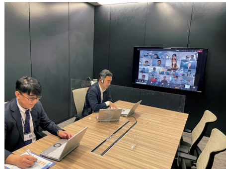
オンラインでの安全運転講習会

クルマ社会の発展とともに成長する当社は、交通事故のない安心・安全な社会の実現に向けて、お客さまの交通事故削減を支援することは重要な使命と考え、お客さま企業の交通事故ゼロを目指し、サポートを続けています。2020年度は、新型コロナウイルス感染症の拡大に伴い、集合形式からオンラインに切り替え、安全運転講習会を開催しました。